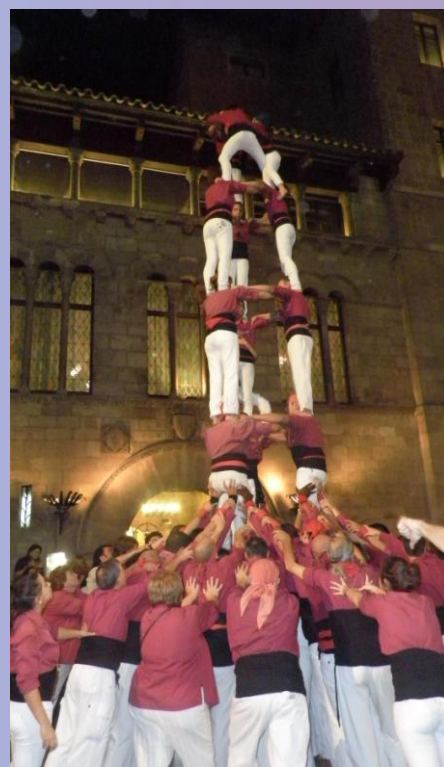
Muntatge d'un castell en honor al congressistes