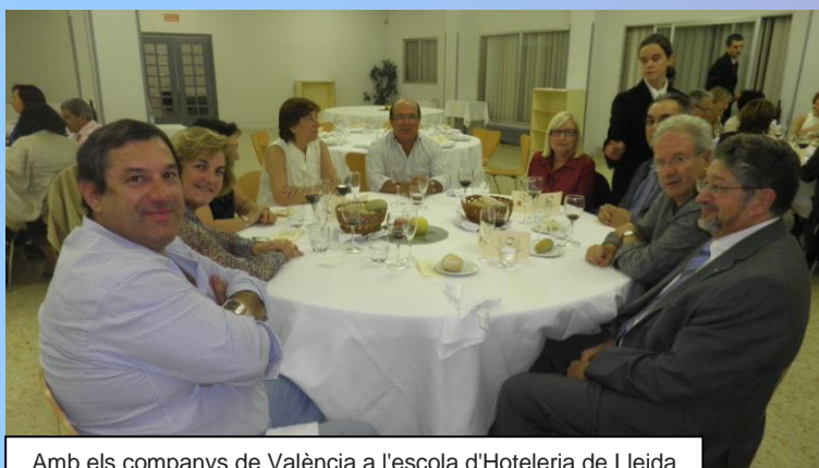
Amb els companys de València a l'escola d'Hosteleria de Lleida

En tot moment es caracteritzà l'extrema puntualitat, la rigorosa organització i la qualitat científica de les ponències.