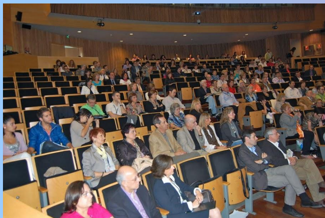
Una sessió de les Jornades