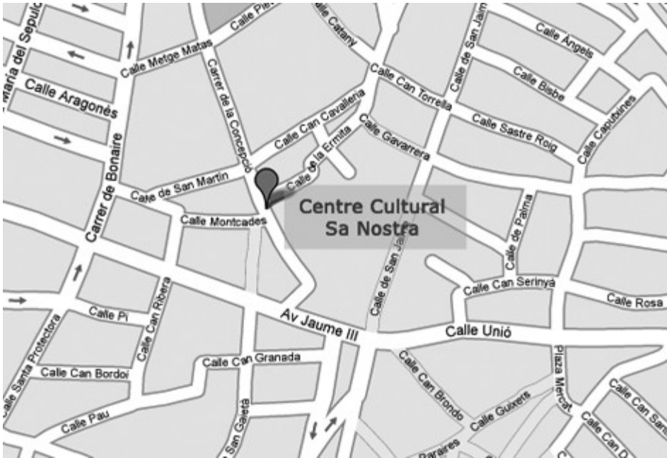
Centre Cultural Sa Nostra C/ Concepció, 12. 07012 Palma de Mallorca Mapa de situació Red Otri (Google Maps)